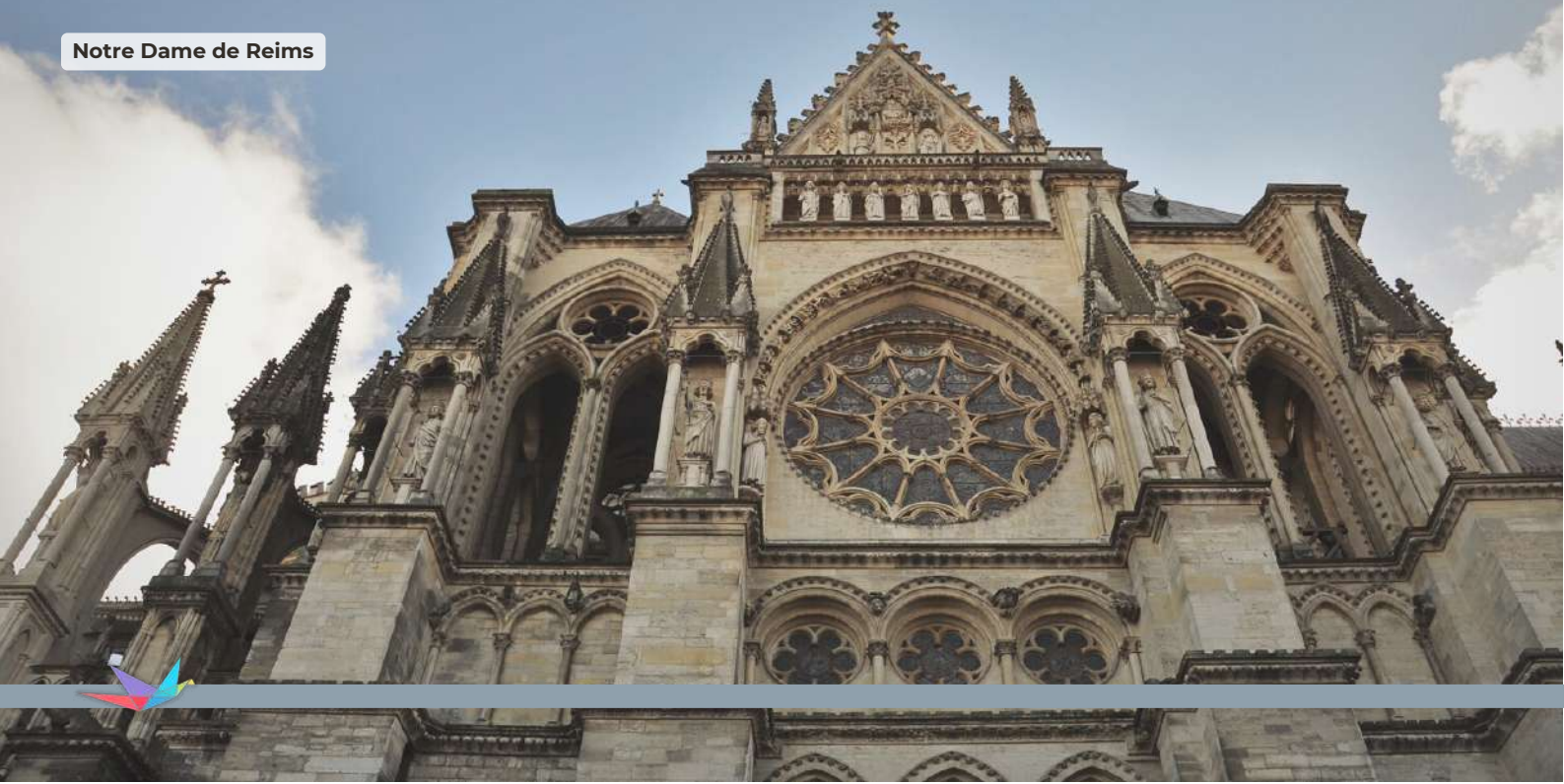
Notre Dame de Reims

La visita continua con otro sitio declarado Patrimonio de la Humanidad por la UNESCO: la magnífica Catedral de Notre-Dame-de-Reims, una obra maestra de la arquitectura gótica europea. Continuará la visita con la Abadía de Saint-Remi, así como con su encantador museo, ambos declarados Patrimonio de la Humanidad por la UNESCO (cena no incluida).